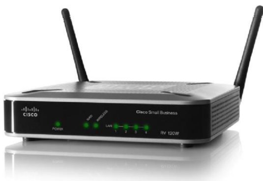
Figura 1. Firewall VPN Cisco RV120 W Wireless-N

El Firewall VPN Cisco® RV120 W Wireless-N combina una conectividad altamente segura (tanto a Internet como a otras ubicaciones y trabajadores remotos) con un punto de acceso inalámbrico 802.11n de alta velocidad, un switch de 4 puertos, un administrador de dispositivos intuitivo basado en un navegador de Internet y compatibilidad con Cisco FindIT Network Discovery Utility, todo a un precio muy accesible. La combinación de alto rendimiento, funciones de clase empresarial y una experiencia de usuario de primera calidad lleva la conectividad a un nuevo nivel (Figura 1).