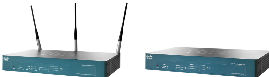
Figura 3. Cisco SA 500 Series Security Appliances: SA 520W y SA 520

En la Figura 3 se muestra el dispositivo Cisco SA 500 Series Security Appliance con y sin conexión inalámbrica.